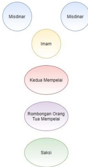
Gambar V.1 Urutan perarakan Sakramen Perkawinan

Sesudah misdinar dan Imam sampai di depan altar lalu berlutut, Imam akan menuju ke mimbar dan misdinar menuju ke tempat duduk masing-masing dengan posisi masih berdiri menunggu sampai mempelai, orang tua, dan saksi sampai di tempat masing-masing.