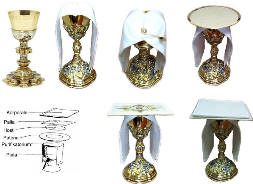
Gambar III.1 Cara menyusun piala

Cara menyusun piala yang benar adalah seperti pada gambar berikut :